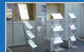
leicht und klein